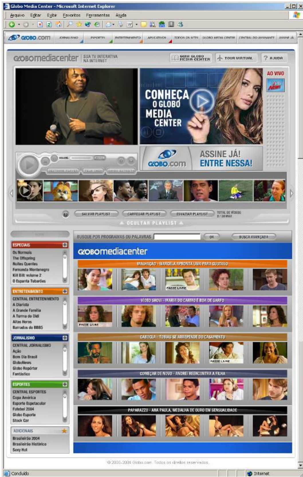
FIGURA 2: Interface do Globo Media Center