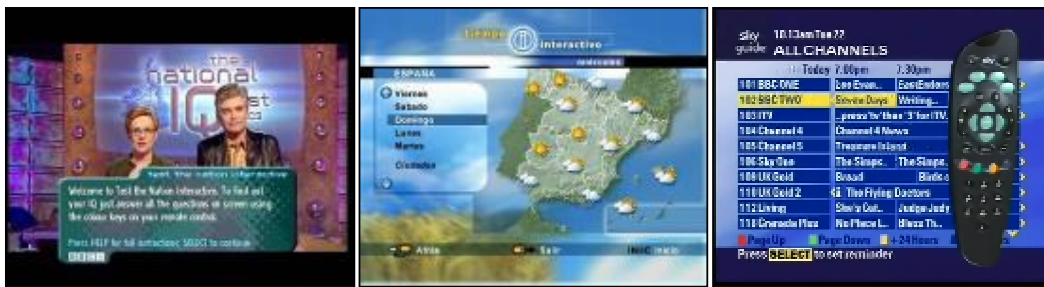
FIGURA 3: Respectivamente: Um modelo de TV Expandida de um programa da BBC onde é feito um teste de QI e a cada pessoa, em casa, responde a perguntas diretamente na tela do televisor; Um Serviço espanhol de previsão do tempo; e o guia de programação da Sky Digital.

Navegação: este último diz respeito à arquitetura de informação do canal ou servidor de canais. Refere-se ao modo como os usuários irão se relacionar com os objetos de interatividade como menus, guias de navegação, programação do canal, etc.