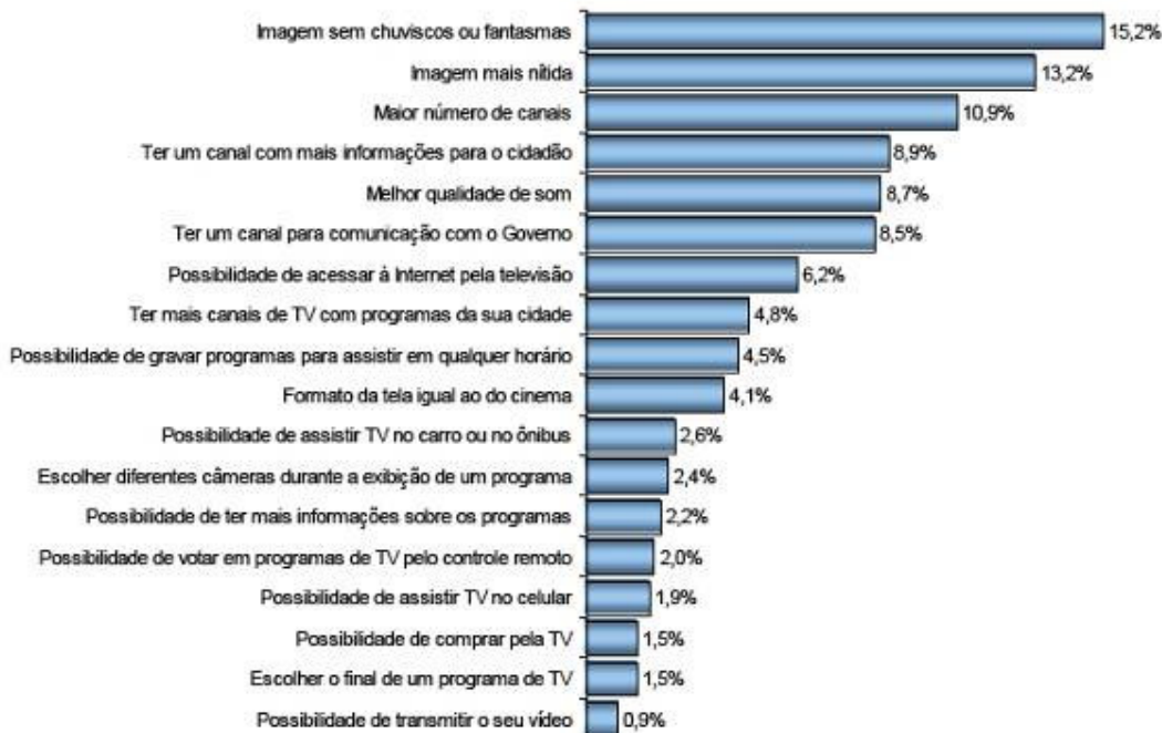
FIGURA 4: Estimativa de uso da TV Digital Interativa para o brasileiro

importante dentre os vários que a TV Digital pode proporcionar. O resultado, abaixo (Figura 4), além de apontar a preocupação da população com relação à má qualidade da recepção do sinal que possui hoje, mostra que essa mesma população anseia muito mais melhorar a recepção do atual produto audiovisual que é pautado pela passividade e pelo entretenimento do que em participar da construção do conteúdo ao qual se submetem.